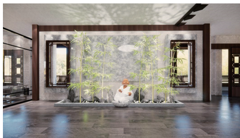
图1 前厅效果图