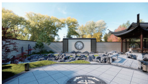
图2 庭院效果图