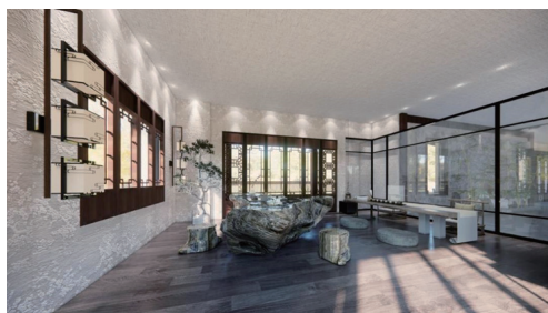
图3 包厢效果图